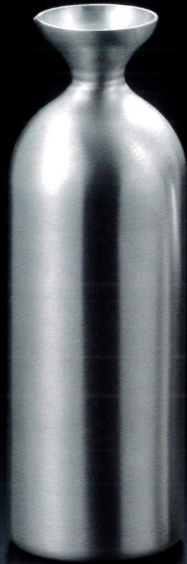
387328 徳利 レギュラー 2合 約360ml

メタル丼と同じく中空2重構造を採用し、熱を逃しにくいので燗酒や冷酒など一定の温度を維持したい日本酒には最適のマスターアイテムです。