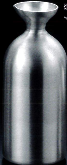
387329 徳利 Jr 1.5合 約270ml