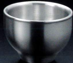
387331 ぐい呑み レギュラー 約50ml