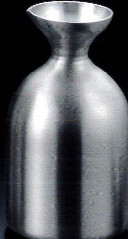
387330 徳利 Baby 1合 約180ml